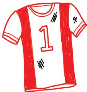
Счастливая футболка, не стирать